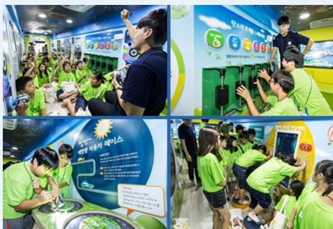
푸른별 환경학교 버스에서 진행되는 다양한 교육 프로그램. 태양광으로 움직이는 자동차 레이스 체험을 비롯해, 환경문제와 신재생 에너지에 대한 수업이 진행